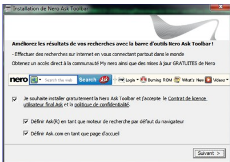
Demande d'installation d'Ask Toolbar avec Nero

Depuis quelques années, vous tombez partout sur les barres d'outils. Soit pour l'installation d'un nouveau logiciel, un fichier à télécharger ou l'installation d'un pilote - on vous demande régulièrement d'installer ces petites barres d'outils. Un spécimen très répandu, c'est Ask Toolbar, une barre d'outil associée au moteur de recherche Ask.com. De nombreux fournisseurs de logiciels vous proposent d'installer cette barre avec leurs propres produits, dont des noms très connus tels que le logiciel de gravure Nero.